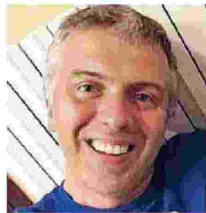
ATTORE Guido Marangoni

che mai avremmo pensato possibili, nascoste nel cuore. Leggendo il suo nuovo libro, si coglie il senso di un ponte tra storie che rendono più lieve la vita e tra cui è possibile una sola comunicazione, l'abbraccio. In questa serata estiva, davanti alla meraviglia della natura, tutti insieme faremo incontri che dureranno, quando lo spettacolo sarà finito. E tutti porteremo con noi un sorriso».