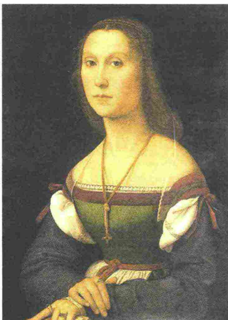
Raffaello Sanzio, La Muta (1507, olio su tavola) conservata alla Galleria Nazionale delle Marche, Palazzo Ducale di Urbino

Palazzo Ducale fino al 1° novembre 2020 www.vieniaurbino.it