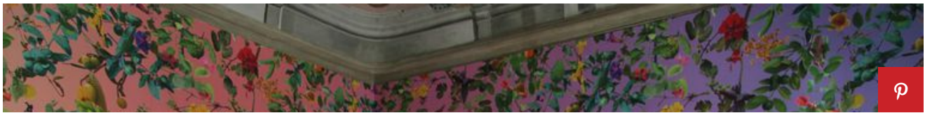
Fallen Fruit.