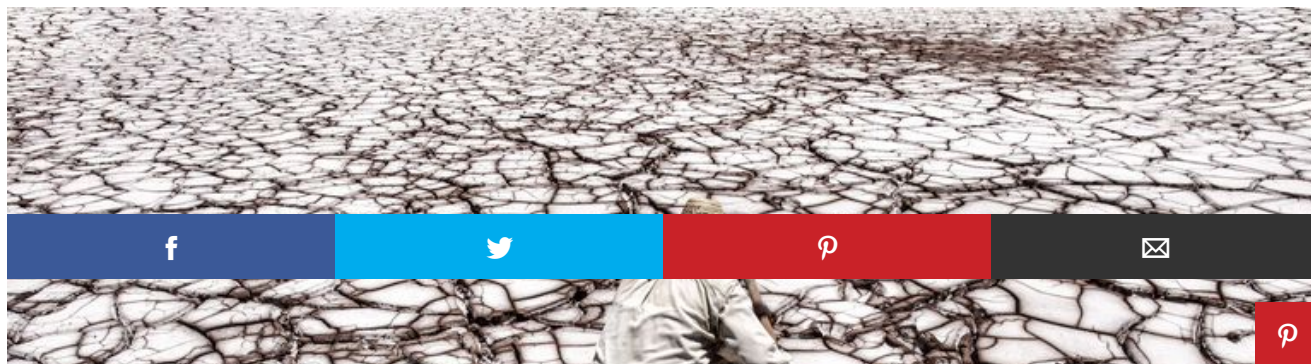
Berberi del Marocco