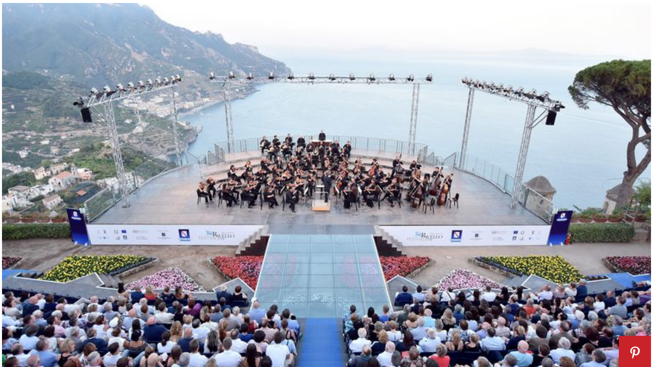
Palco Villa Rufolo, Ravello.