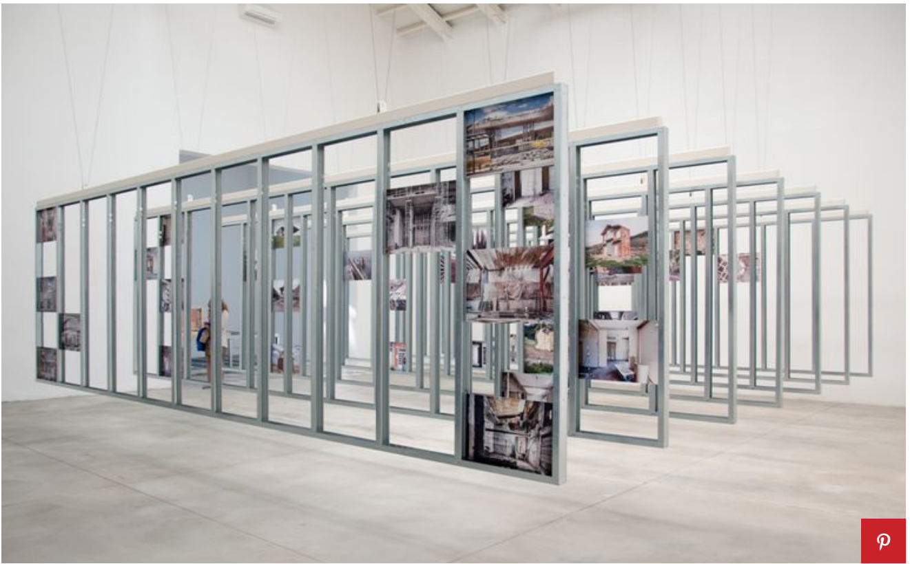
Mostra Internazionale di Architettura Venezia 2016 Padiglione Spagna.