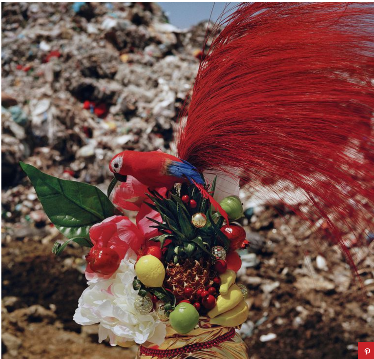
Goldschmied & Chiari (goldiechiari) Fumo Queen (2008) stampa fotografica - Festival del paesaggio, Capri.